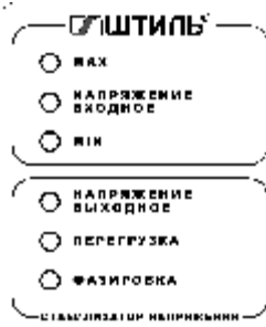
Рисунок 4.1 Передняя панель стабилизатора

На одной из боковых панелей стабилизатора расположены одна или две розетки (в зависимости от модели) с заземляющим контактом для подключения нагрузки, на нижней панели – выключатель СЕТЬ со встроенным предохранителем и выведен сетевой шнур для подключения стабилизатора к сети.