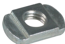
651 9 0XX